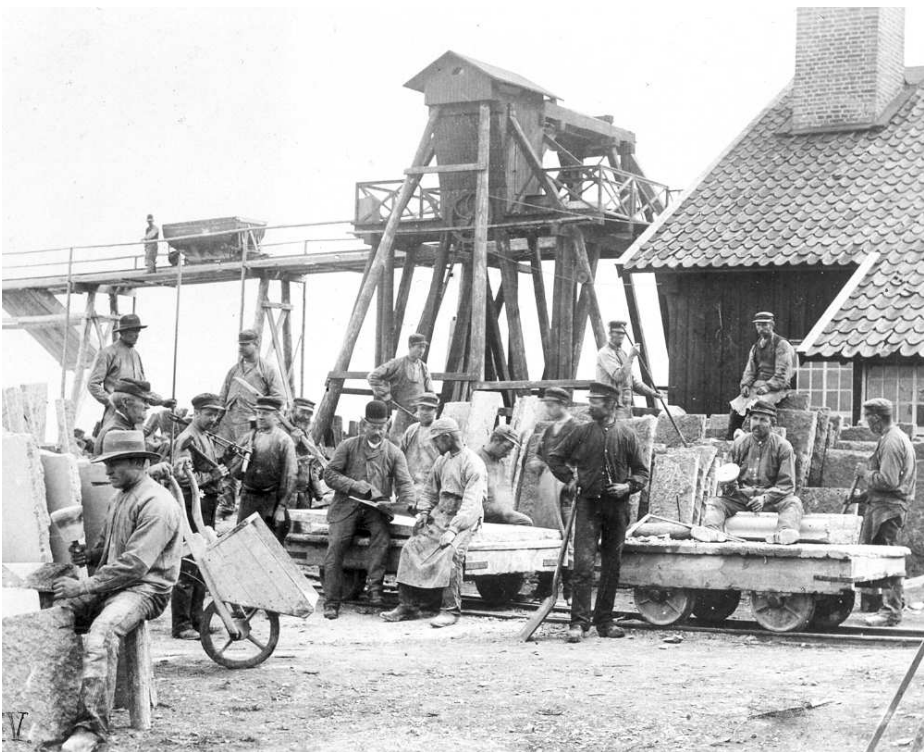
Stenhuggeriet och dess arbetare omkring år 1895.

Gamla verkstaden är byggnadsminne sedan 1984. Den inrymmer fyra stenhylvar, kantsåg, kontor, matrum, smedja och lokaler för manuell huggning. Alla maskiner är restaurerade och kan visas i drift. I nya verkstaden finns ytterligare maskiner, bland annat flera svarvar. Verksamheten bedrivs helt ideellt av Föreningen Stenhuggeriets Vänner och anläggningen ägs av stiftelsen Råbäcks Mekaniska Stenhuggeri.